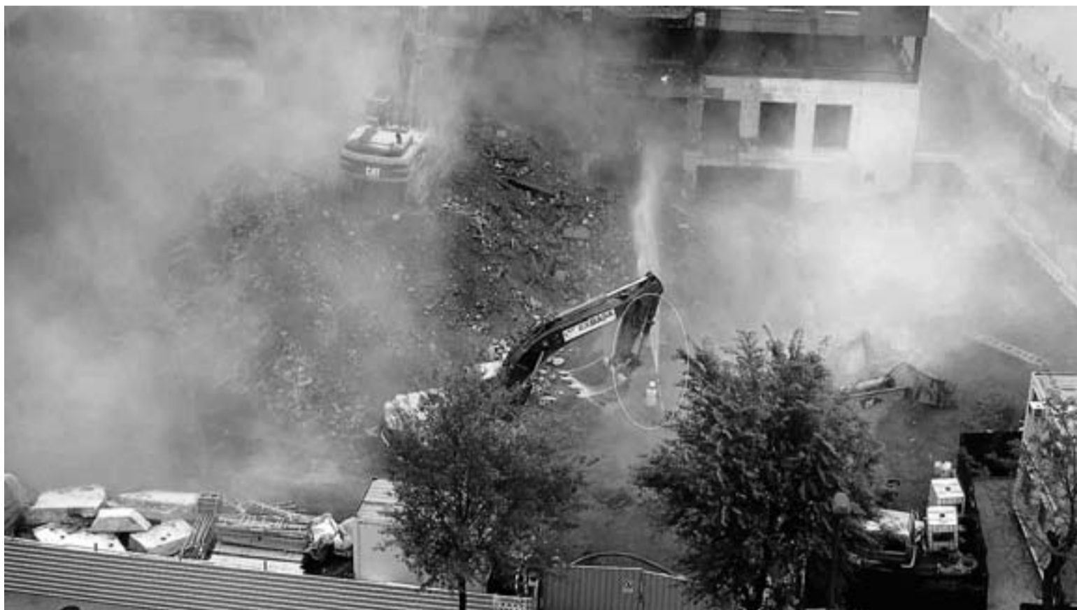
La demolición de parte del edificio llenó la atmósfera de partículas de polvo en el barrio de Ibarrekolanda.

Durante varias horas, una nube de polvo convirtió Ibarrekolanda en un lugar fantasmagórico. Las excavadoras comenzaron a faenar sobre las nubes de la mañana y, al poco tiempo, «provocaron una nube de residuos». Los afectados se quejan de que la BBK, propietaria del edificio y encargada de las obras, no tomó «las medidas preventivas para evitar este incidente». Sostienen que habría bastado con el funcionamiento de varias mangueras de boca de riego «y no con sólo una como se