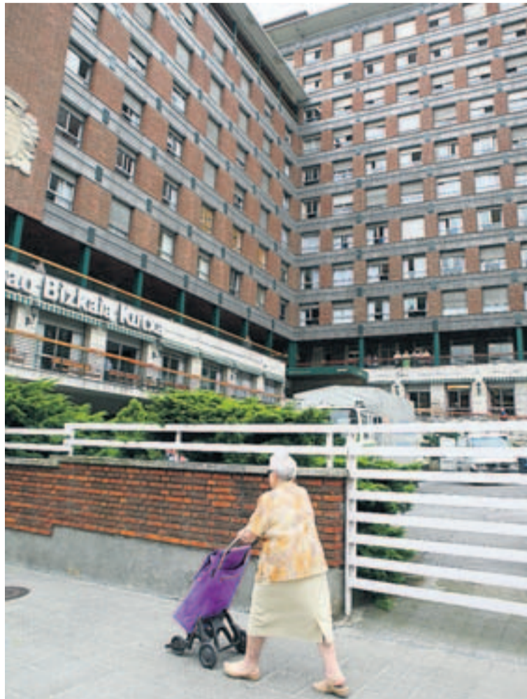
OFERTA. La propuesta inicial contempla duplicar plazas.

La caja de ahorros anunció que el nuevo complejo, que también dará cabida a jóvenes y discapacitados, abriría sus puertas a finales de 2011. Algo que sólo puede cumplir si los trabajos arrancan cuanto antes. De momento, está elaborando el proyecto constructivo y el plan de viabilidad económica. La propuesta inicial, elaborada por la ingeniería Idom, contemplaba una inversión de 50 millones de euros